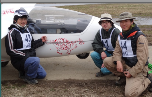
本日のホットショット ～俺が虎だ！龍谷・立命23～