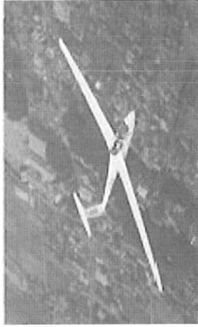
市有グライダー「めぬま号」

※滑走路内は、危険ですので絶対に入らないでください。天候等の都合により、内容の一部が変更される場合があります。