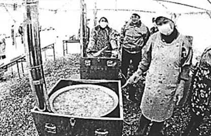
もはやグライダーフェスの名物となっている「喰子」

専航中のグライダーを背景に、熊谷出身グループ「自画自賛」に「お祭り気分が盛り上がるよ」とは、森さん、このコラボング「アングスの風になりたい」、そして愛媛県中学校吹奏楽部による「宇宙戦艦ヤマトメドレー」等々、盛大なステージを披露していただいた。またMCの2人による爆笑選手紹介が予定されていたが強雨脚により中止となった。